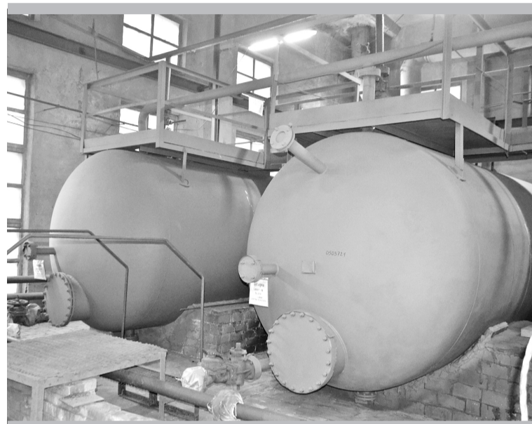
Идеальный порядок на складе олеума цеха № 4

«Мы отдаём себе отчёт в том, что состояние наших бытовых помещений далеко от иде-