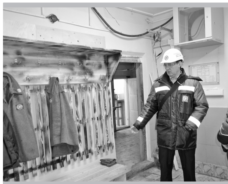
В комнате смен цеха № 1