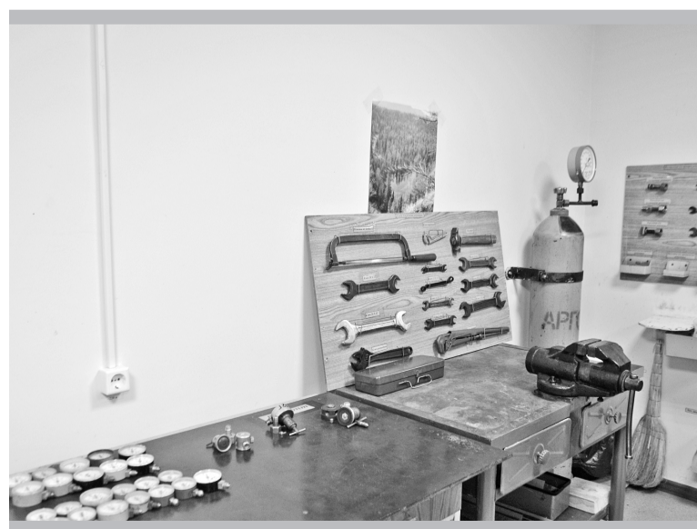
В цехе № 16

Примерно в таком же ключе проходил разговор в редукторной цеха № 16 (следующий адрес).