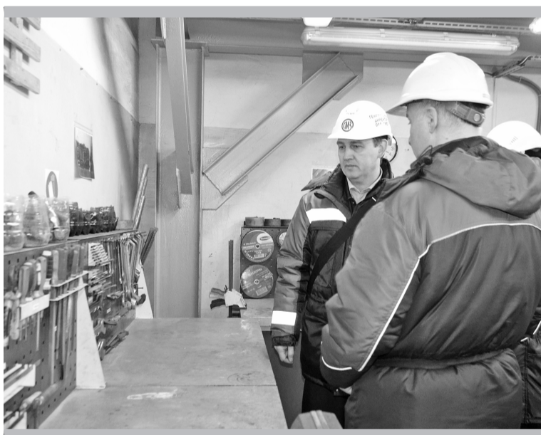
В цехе № 9